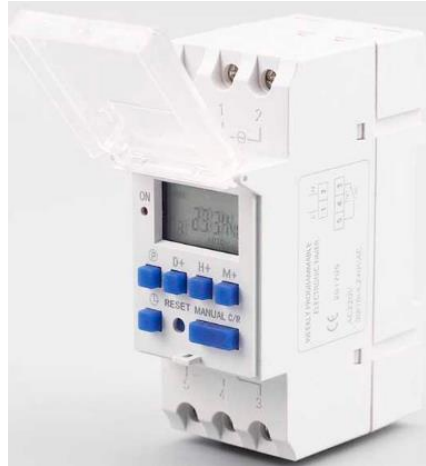
INTERRUPTOR HORARIO PL-IHD TP8A-16